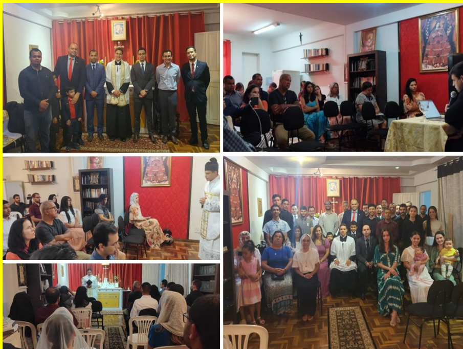
Evento "A santificação pessoal e os meios para se santificar", na Sala MBC

qual enfatizou, oportunamente, que todos somos chamados à santidade, e os sacramentos são os meios mais eficazes de alcançá-la. Fazemos votos de que os padres do IBP retornem sempre às terras norte-mineiras. Rezemos por seus apostolados, tão benéficos às famílias católicas no Brasil.