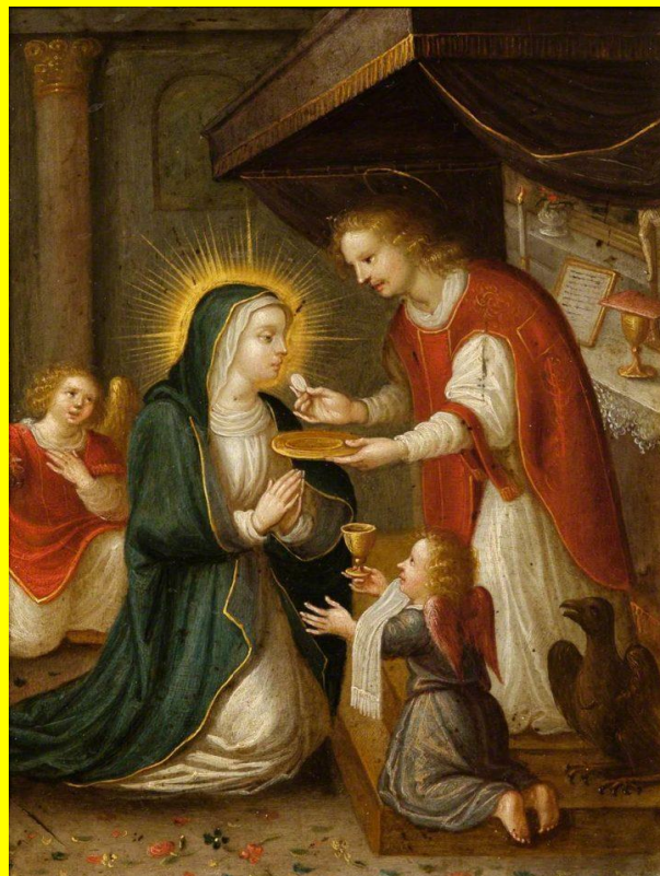
Santíssima Virgem recebendo a Sagrada Comunhão de São João

Essa missa celebrada por S. João, a que Maria assistia, é a reprodução mais impressionante do sacrifício da cruz perpetuado substancialmente sobre o altar.