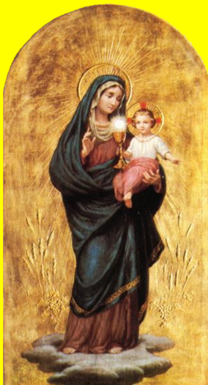
Nossa Senhora do Santíssimo Sacramento

Convém particularmente insistir sobre o que deveria ser para a Mãe de Deus o sacrifício da missa e a santa comunhão que ela recebia das mãos de São João.