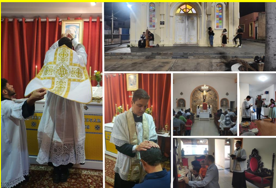
Santas Missas, confissões, visitas às famílias e bênção neo-sacerdotal